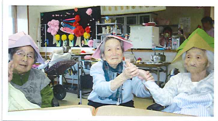
手を取って・・・「久しぶりや」「うれしいなあ」

端午の「端」は物のはし、始まりという意味で元々、「端午」は月の初めの午の日のことだったそうです。後に「午」は「五」に通じることから毎月5日となり、その中でも数字が重なる5月5日を「端午の節句」と呼ぶようになったそうです。松林荘では5月4日端午の節句の行事を行いました。皆様、紙で作った兜にいろいろな飾りつけをされていました。その兜をかぶり童心にかえって、楽しんでおられる姿を写真で撮ろうとしたときには、少し恥ずかしそうにされていたのが印象的でした。最後に皆でこいのぼりの歌を歌うと、「久しぶりに歌ったけん、懐かしい気持ちになったよ」と昔を思い出し、楽しそうに笑っておられました。 1階介護職員 川田 拓也